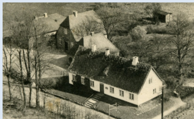
Rytterskolen med tilbygninger omkring 1942.

Rytterskolen tjente som skole indtil 1942. Undervejs blev den udvidet med de to røde bygninger, der i dag er private boliger. Den lave blev bygget i 1901 og siden blev den høje ejendom opført i 1924.