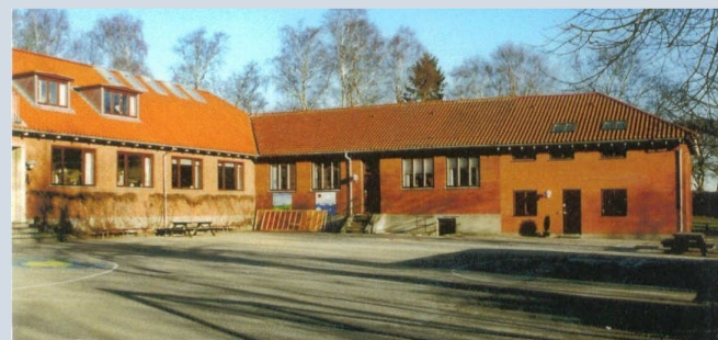
Karlebo Centralskole o. 2005.

Skolen er i dag en forskole med 0.-5. klasse under Fredensborg Skole. Bag skolebygningerne er etableret en udeskole med køkkenhave, udekøkken, bålplads.