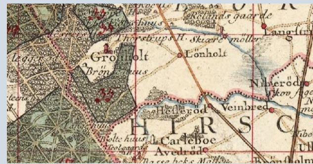
Videnskabernes Selskabs kort fra 1810.

Vejforløbet er tegnet af den franske vejingeniør Jean Marmillod omkring 1765 med lange snorlige strækninger. Vejen var færdiganlagt fra København til Fredensborg Slot i 1775. Arbejdet er udført med håndkraft og hestevogne af lokale bønder og udskrevne soldater.