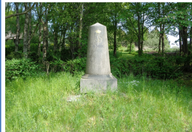
Milepælen ved Fredensborg Kongevej 2019.

Den er kegleformet og opsat 1837 med inskription: "4 MIL F5" og udført af bornholmsk granit. De 4 mil er målt fra Københavns byport og svarer til 30 km. F5 står for Frederik V.