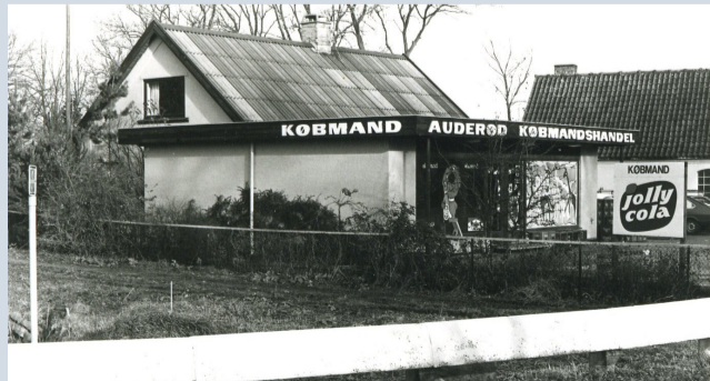
Avderødvej 28-30.

Indtil 1982 var dette landsbyens handelscentrum med smed og købmand. Smedevirksomheden er kendt fra begyndelsen af 1700-tallet, hvor hestene i landsbyen skulle holdes med sko.