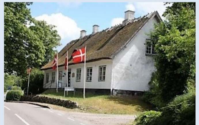
Fredensborg Museum i den gamle rytterskole.

Sognerådsalen fik til huse i den lave røde bygning.