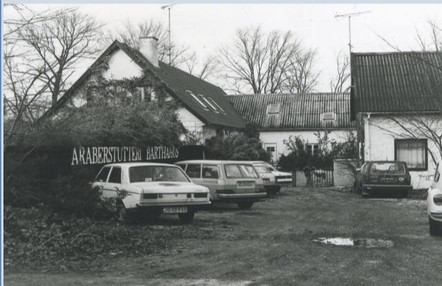
Avderødvej 20 i 1980.

Gården er en af de store gårde i landsbyen, og har huset så forskellige ting som strikkefabrik fra 1956 og araberstutteri i 1980'erne. Der har også ligget kontor- og softwarefirma i bygningerne.